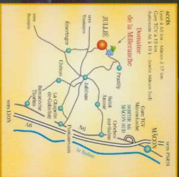
Conception réalisation © Richard Bonin édition - 71570 La Chapelle-de-Guinchay

Terra Vitis Observer, respecter pour produire